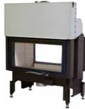
75x39S II - Art. no. 360045

* laut landesüblicher Installationsnormen • specification concerning fire prevention and thermal insulation • in ottemperanza con le normative locali vigenti • selon les normes d'installation régionales en vigueur