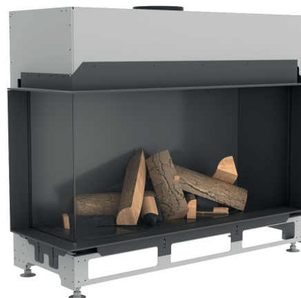
Ekko G L 100 с футеровкой чёрная сталь (матовая)